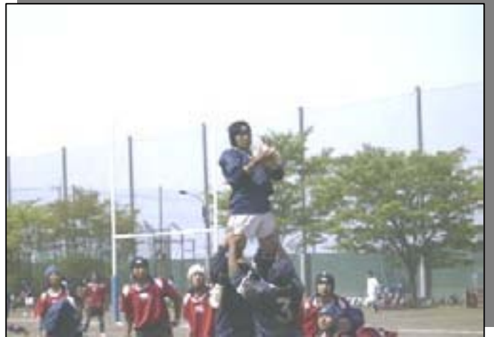
春の関東予選 初戦は伊奈学園と対戦 期待の1年生が5人出場した。 中学からの経験者とはいえまだまだ新人。 これからが楽しみです。