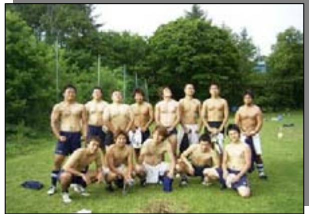
大学4年までのOB17名が集結！