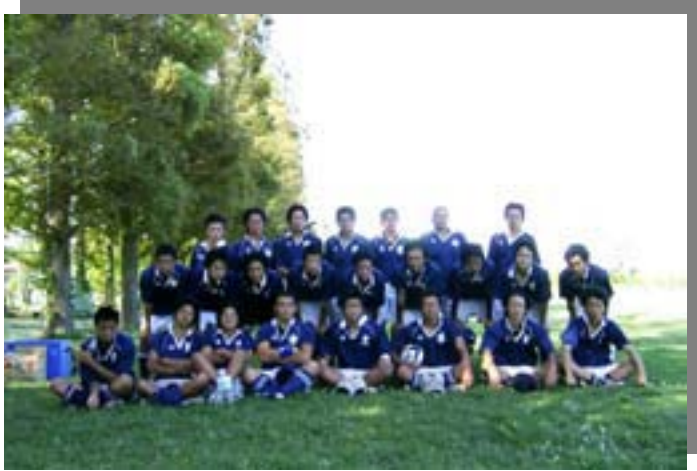
2005年度 立教高校ラグーマン