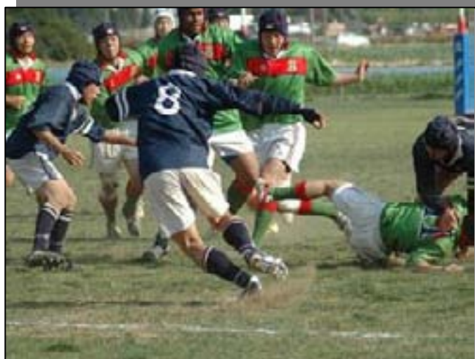
春の関東予選第二戦 全国レベルのチーム正智深谷と対戦 全国レベルを体験。 敗戦はしたが、この経験は必ず秋に生きてきます。